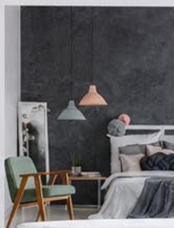
HG07-006 Виноградный сироп Нанесение кельмой

«Формат Линнея» — это наглядная презентация с вариантами использования декоративной краски с эффектом матового шелка. Здесь собраны визуальные и тактильные эффекты, созданные различными инструментами и техниками нанесения.